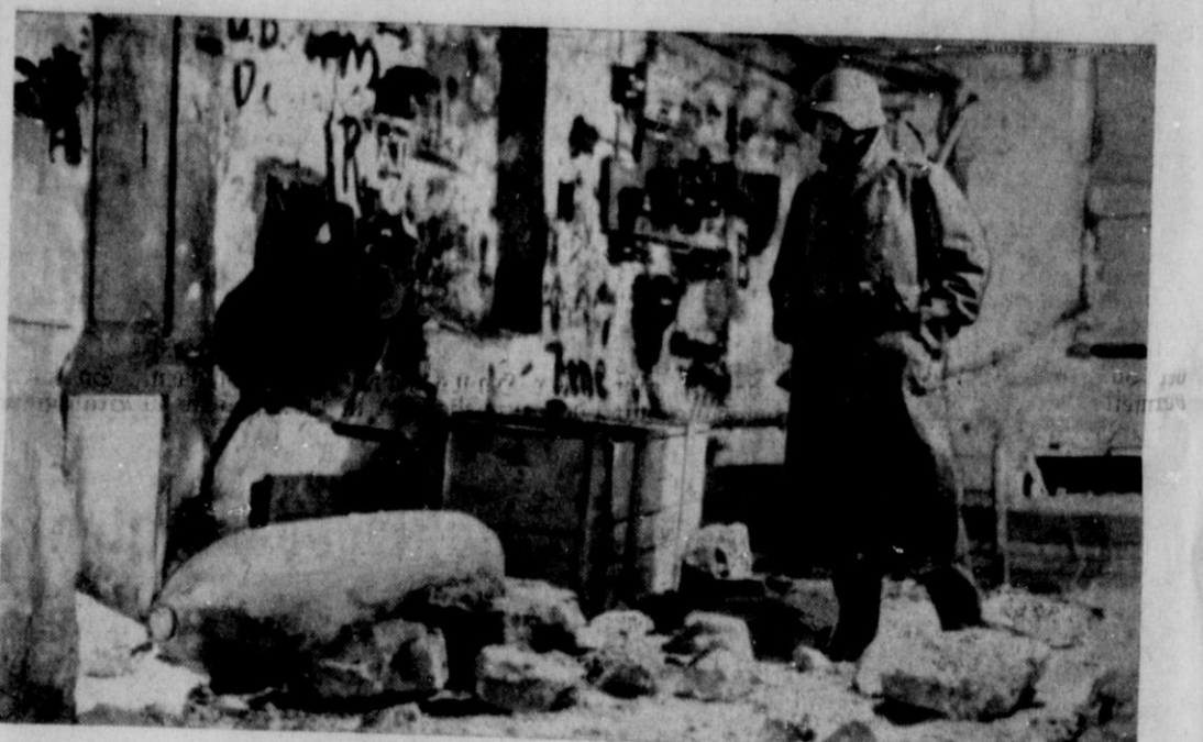
Ein unheimlicher Gast in Basel

Vor einiger Zeit warfen bekanntlich englische Flieger bei ihrem nächtlichen Einflug in die neutrale Schweiz Bomben auf die Stadt Basel. Diese englische Fliegerbombe kam jedoch nicht zur Explosion.