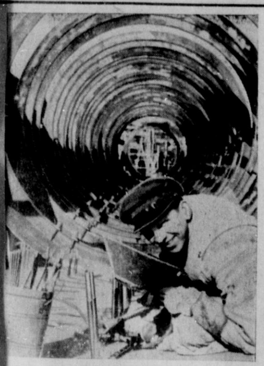
Auf allen deutschen U-Boot-Werften herrscht Hochbetrieb

Am Druckkörper des Unterseebootes gibt es für den Schweißer viel Arbeit. Aber wie man hebt, leistet er sie fachverständig und vergnügt. (Atlantic, Submann, Zander-Multiplex-R.)