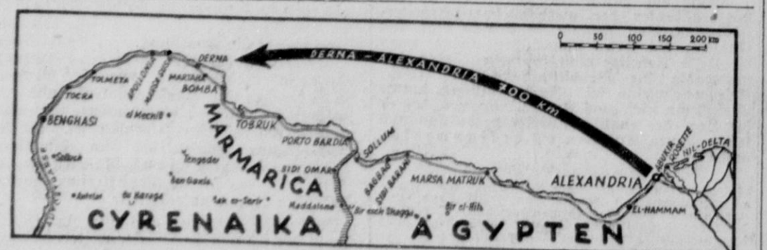
Karte zum italienisch-englischen Kriegsschauplatz in Nordafrika (Kartendienst Erich Zander, M.)

Wenn Frankreich auch zweimal zum Cäsarismus mit den beiden Napoleon und ebenfalls zweimal zum Königtum unter den Bourbonen und Orleans zurückkehrte, so war doch das ganze neunzehnte Jahrhundert erfüllt von dem leidenschaftlichen Verlangen, an dieser Erregungsschicht der Revolution festzuhalten. Das Wort „Republik“ bildete die Wegscheide, an der sich die guten Franzosen von den schlechten Franzosen trennten, auch nachdem der Bonapartismus als Partei keine Rolle mehr spielte und der Royalismus sich in einen stillen Winkel zurückgezogen hatte, den ihm der Adel mit der „Actaot Française“ immer noch offen hielt. Ein guter Republikaner zu sein war das Mindeste, was von einem Politiker verlangt