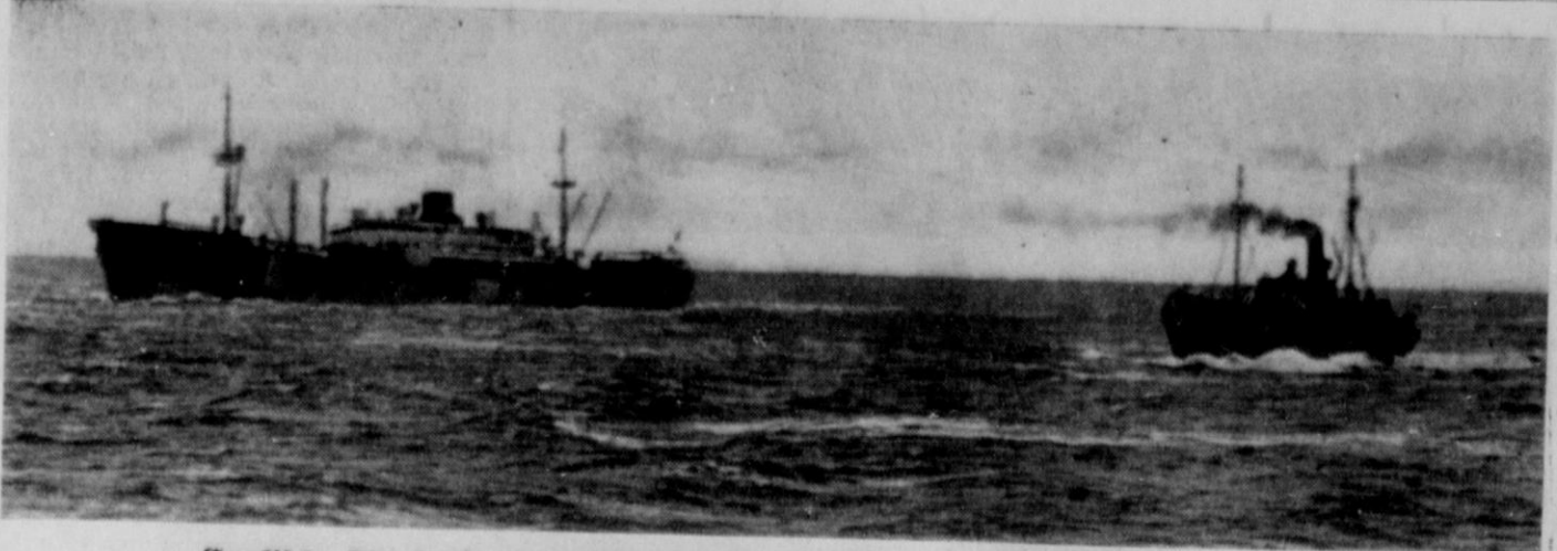
Englische Finnland-Freiwillige auf dem Rücktransport in der Nordsee geischnappt

Der Mann ist berufen zu schaffen. Die Schaffenden sind hart. Also ist Härte eine männliche Tugend. Und in harten Zeiten, in schöpferischen Zeiten ziemt es dem Manne nicht,