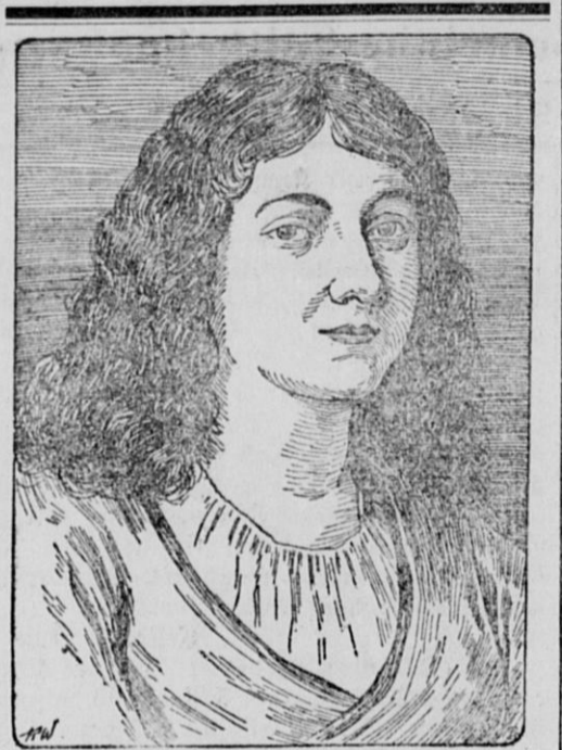
Charlotte v. Schiller.