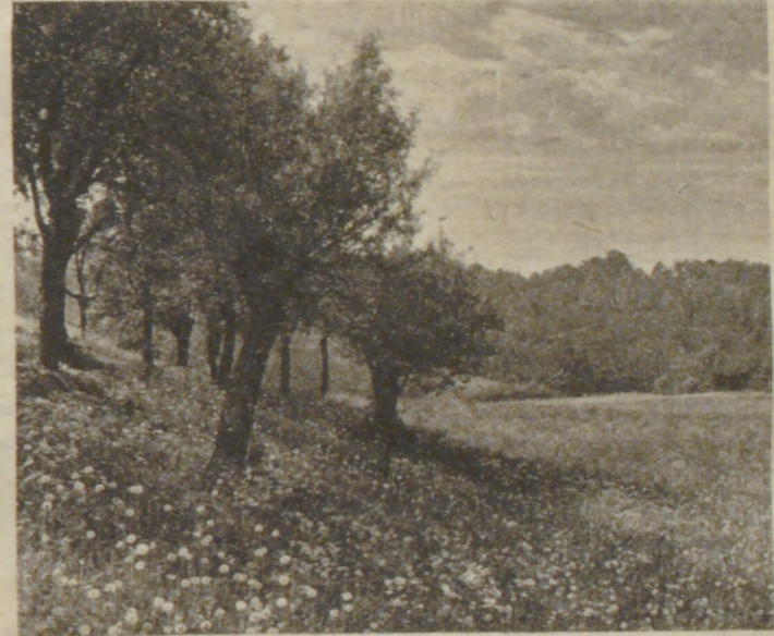
fj. Kreikemeyer: Blumige Wiese.