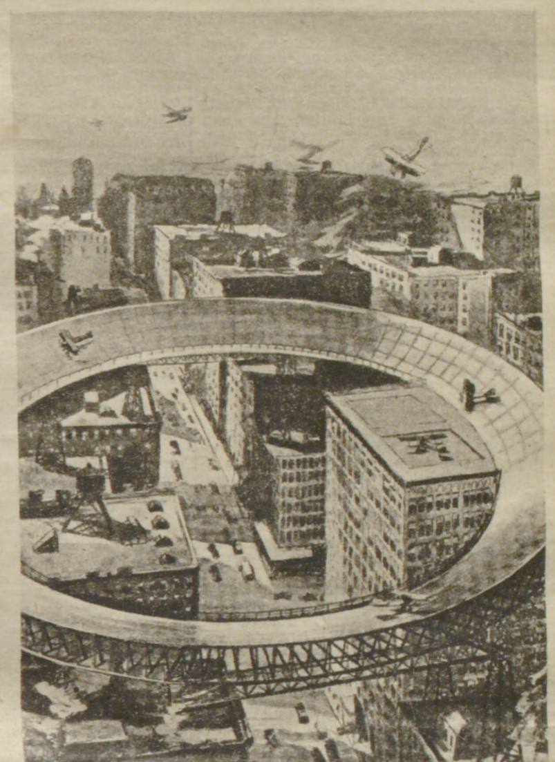
Kreisförmiger Landungsteg mit Lift und Unterkunftshaus für Flugmaschinen