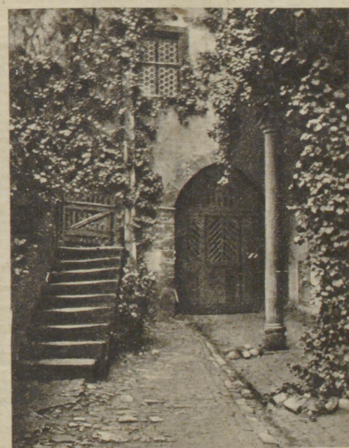
Frñh Kramme: Alter Hof in Rothenburg.