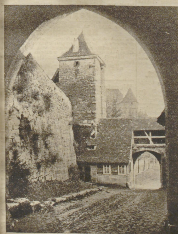
Frñh Kramme: Rothenburg (Kobolzellertor).