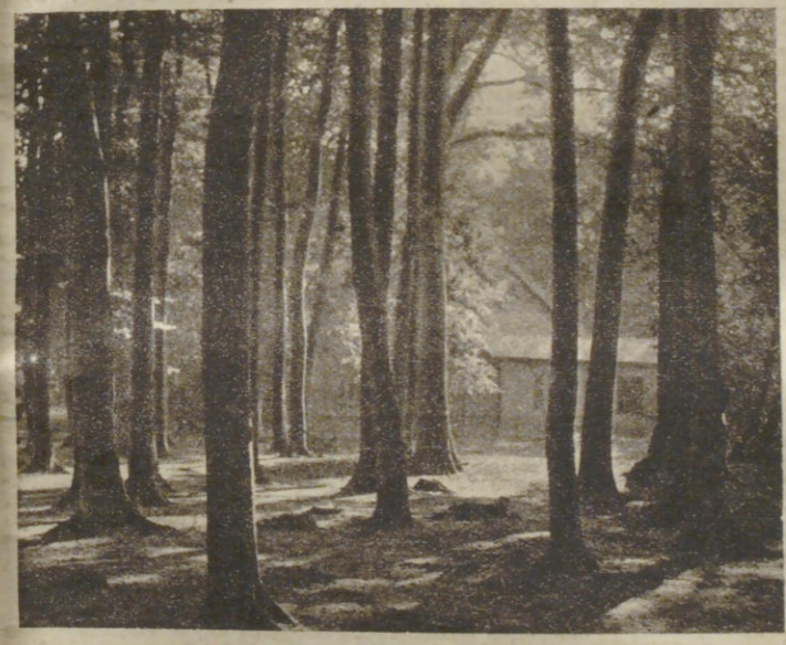
Raetz: Am Borsteler Jäger.