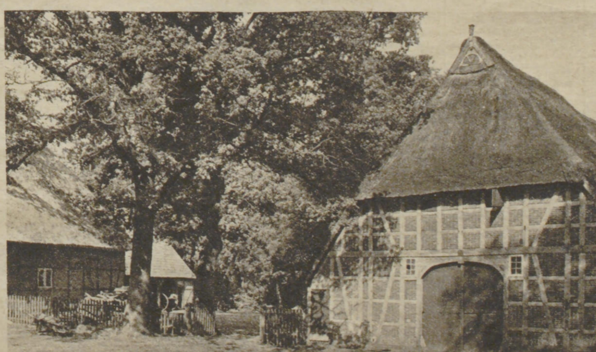
fj. Kreikemeyer: Altes Bauernhaus.