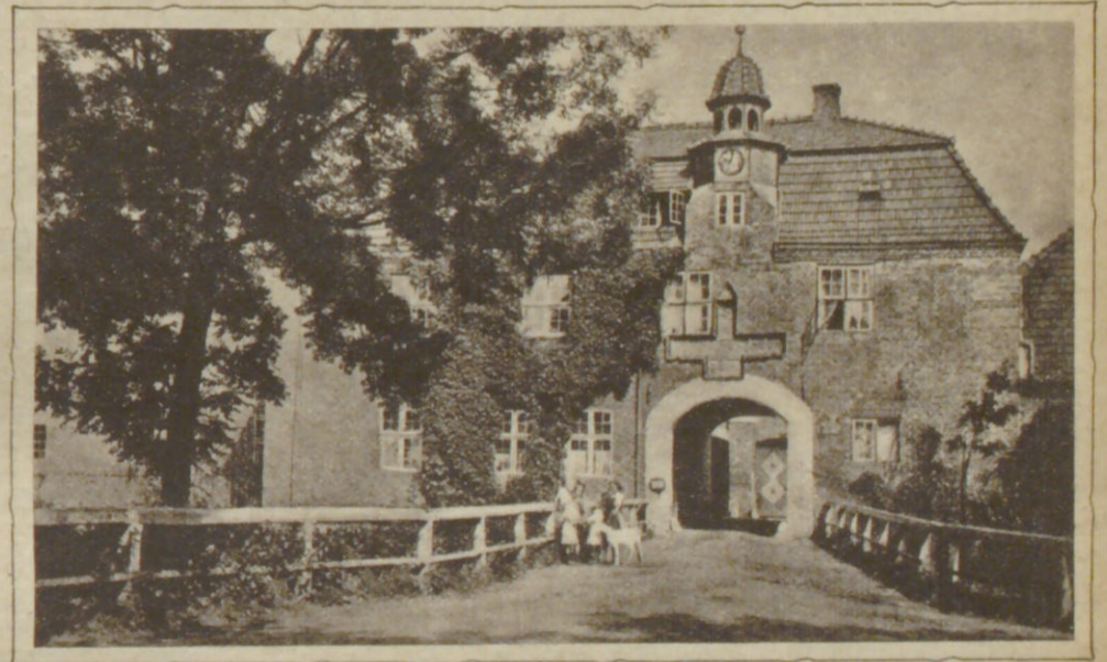
Torhaus des Gutes Ludwigsburg (Kohöved) bei Eckernförde.