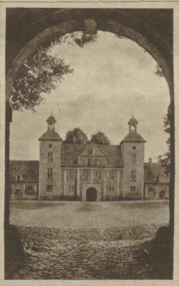
Torhaus des Gutes Bothkamp bei Kiel.