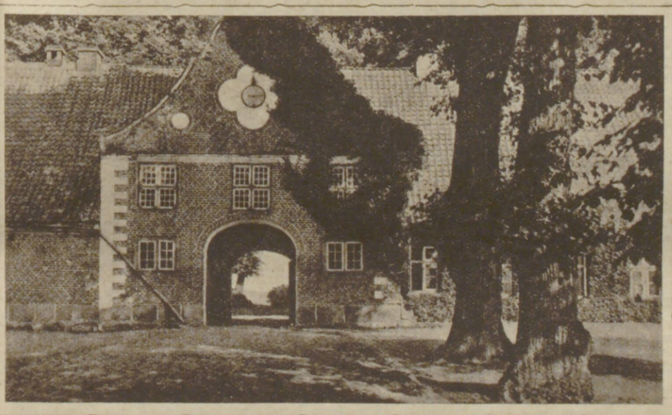
Torhaus des Gutes Rasdorf bei Preest.