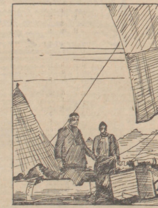
Text & Bilder, Stockholm.

ein, „Sie kann einen Radioapparat mitnehmen“, antwortete er, und auf kurze Entfernung wird sie Euch sicher hören und die Meldung erhalten, wo Ihr Euch befindet. So weit werdet Ihr doch bis zu dieser Zeit vom Wind nicht getrieben worden sein, daß die Entfernung größer wäre als die, die wir heute von der „Gitta di Milano“ haben? Wenn die Expedition nach dem Eismarsch käme, würde sie doch Guern Lager schon sehr nahe sein.“ Ich nahm diese Versicherung meines Freundes sehr skeptisch an und fragte dann — obwohl dies mit der vorangegangenen Unterredung gerabezu