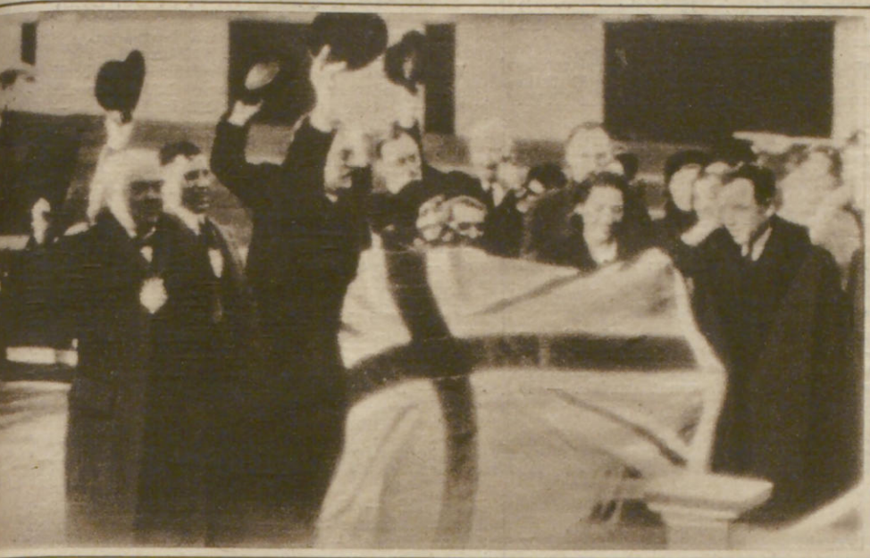
Amy Johnson wieder in London Die englische Fliegerin Amy Johnson hat den Flug Kapstadt-London in 7 Tagen 5 Stunden zurückgelegt und damit einen neuen Rekord geschaffen. Die Fliegerin wurde bei ihrer Ankunft stürmisch begrüßt.

104. Jahrgang • 4. Vierteljahr • 2. Beilage