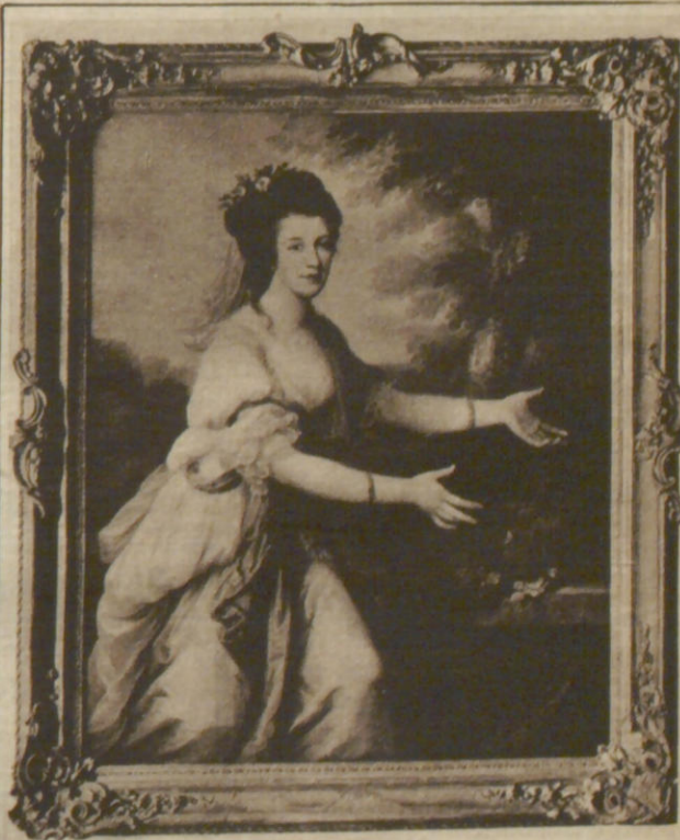
Bildnis der Julia Reventlow, geb. Gräfin Schimmelmann, Tochter des Schatzmeisters, von Angelica Kauffmann.

im Besitz der gräflich Schimmelmanschen Familie, wird am 1. Weihnachtstag in Verbindung mit einer Ahrensburger Heimatausstellung erstmalig für einige Zeit der Öffentlichkeit zugänglich gemacht werden. Das Hauptinteresse werden die Festräume bean-