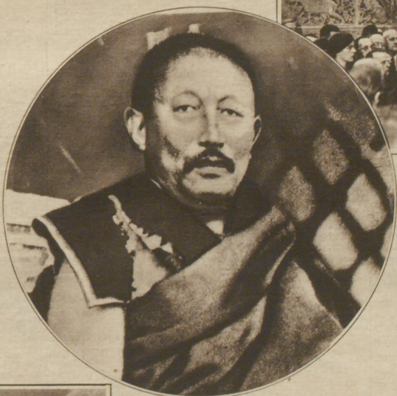
Der Panchen Lama, der lebende Buddha, soll, wie verlautet, aus seiner Zurückgezogenheit entfliehen sein und sich in Peking niedergelassen haben. Dieses Bild soll das erste sein, das von dem religiösen Oberhaupt von fünf Millionen Menschen gemacht worden ist.