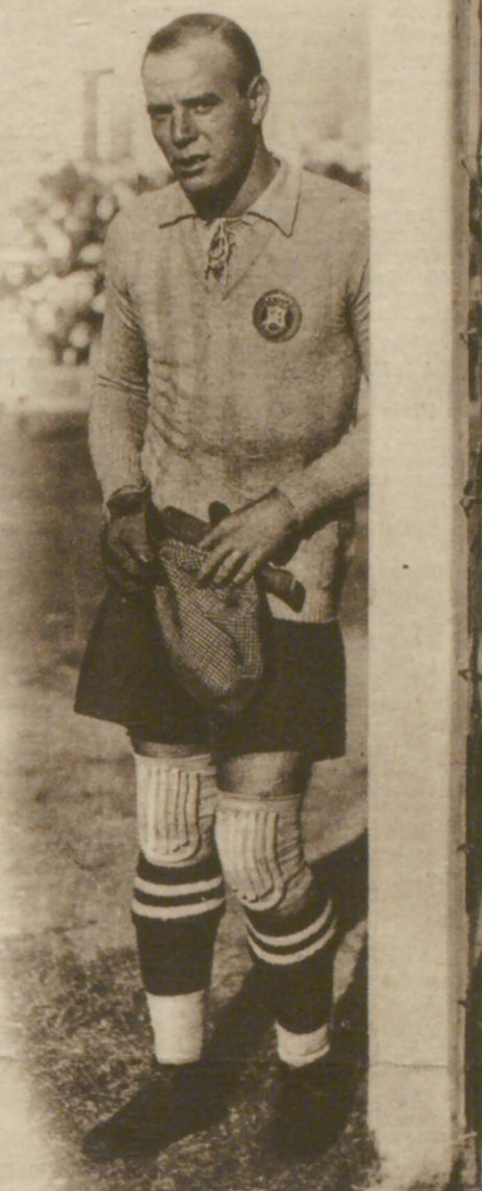
Zamora, Spaniens populärster Fußballtorwart, geht als Profi nach Argentinien.