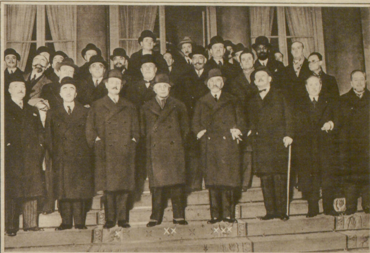
Die Neuen Das neue Kabinett Paul-Boncour. Chautemps (x), der neue Ministerpräsident Paul-Boncour (x x), Marin (x x x).