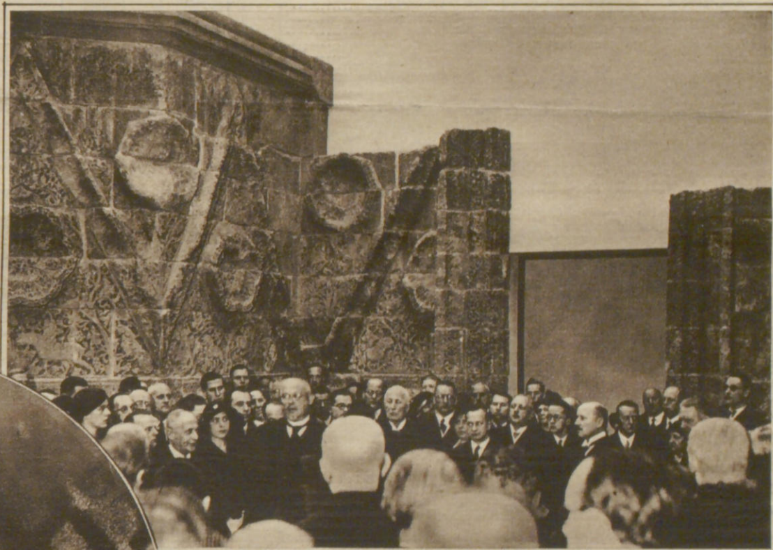
Im Vorderasiatischen Museum in Berlin wurde am Sonnabend eine islamische Abteilung eröffnet.