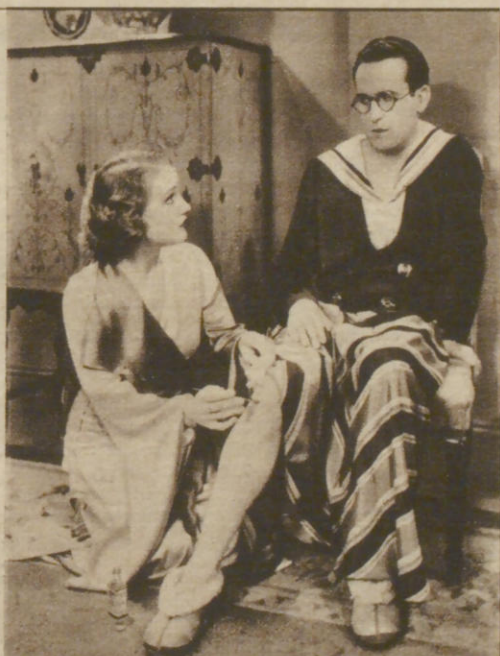
Harald Lloyd in seinem neuen Schlager »Filmverrückte«, der gegenwärtig im Ufa-Palast läuft.