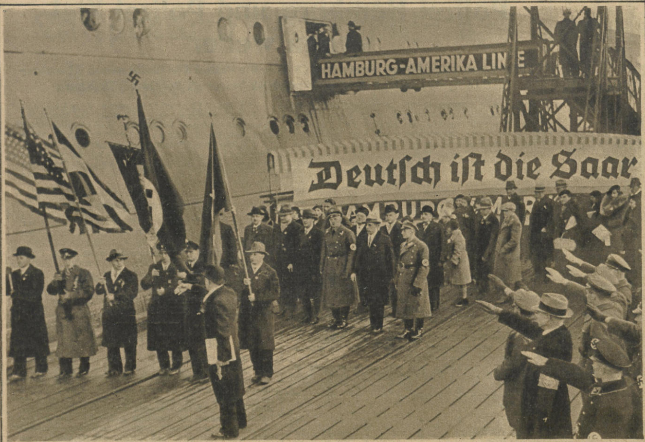
Festlicher Empfang Abstimmungs- berechtigter von Übersee. Die Saarländer mit den National- flaggen des Reiches, dem Sternen- banner und ihren Vereinsfahnen nach der Landung des Dampfers »Deutschland« in Cuxhaven am Pier