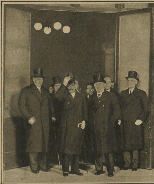
Staatsbesuch des französischen Ministerpräsidenten in Rom. Mussolini und Laval bei dessen Ankunft