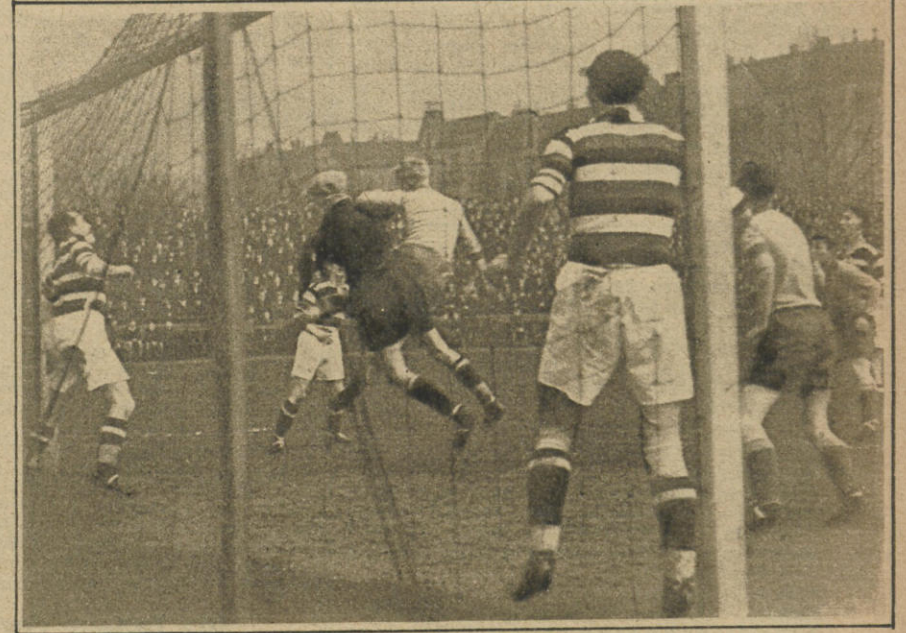
Fußball Victoria—Altona 93 1:0. Ecke vor dem Altonaer Tor