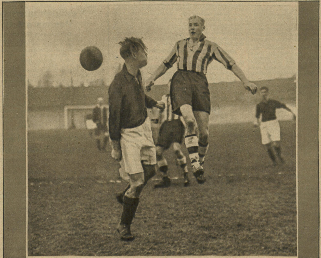
Fußball FC St. Pauli—Borussia, Kiel 1:0