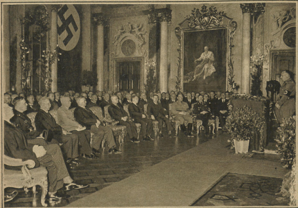
Übernahme der bayrischen Justiz durch das Reich. Blick in den festlich geschmückten Repräsentations- saal des Justizpalastes in München während der Ansprache des Reichsministers Dr. Frank