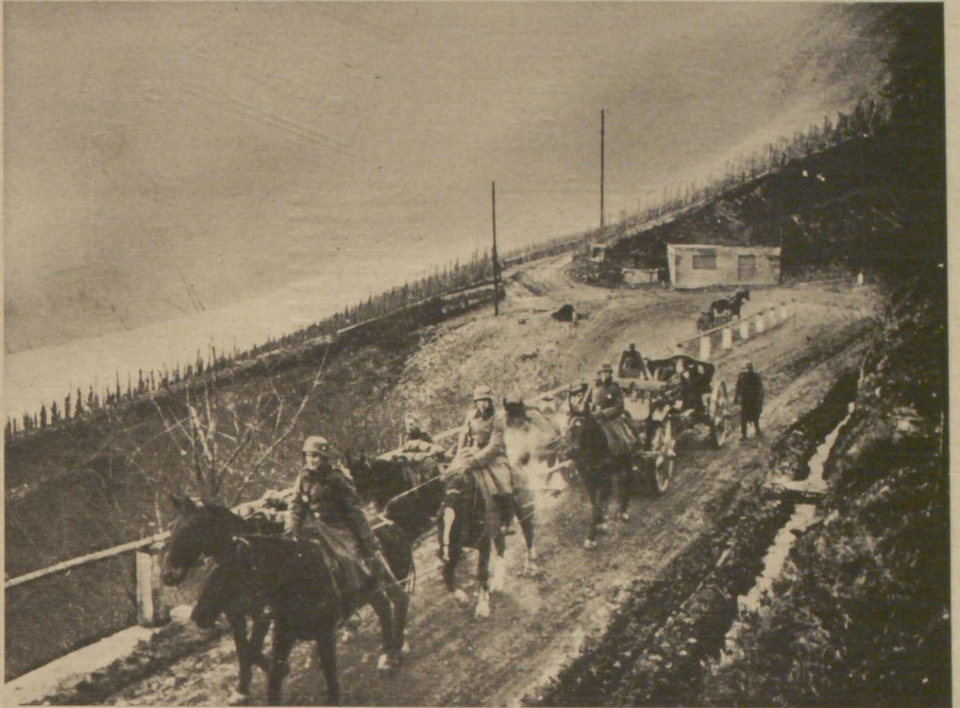
Artillerie geht im Westen in Stellung