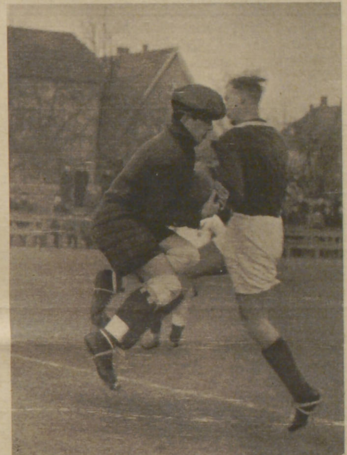
Uhlenhorst — Klipper 1:2. Trotz des harten Bodens gab es ein schönes, flottes Spiel. Der hartbedrängte Klipper-Torwart kann hier klären Eimsbüttel — Phoenix-Lübeck 9:0. Der Phoenix-Tormann schnappt dem angreifenden Baldauf den Ball vom Knie

Gott hat uns die Zeit geschenkt, aber von Eile hat er nichts gesagt. Sinnliches Sprichwort