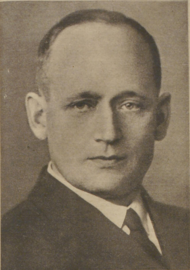
Der Kommandant des Panzerschiffs »Admiral Graf Spee«, Kapitän zur See Hans Langsdorff

Kupfertiefdruckbeilage des Hamburger Fremdenblattes • Für hervorragende Leistungen in Kupfertiefdruck: Großer Preis Turin 1911 • Gent 1913 Montag, 18. Dezember 1939 111. Jahrg. • 4. Vierteljahr • Nr. 349