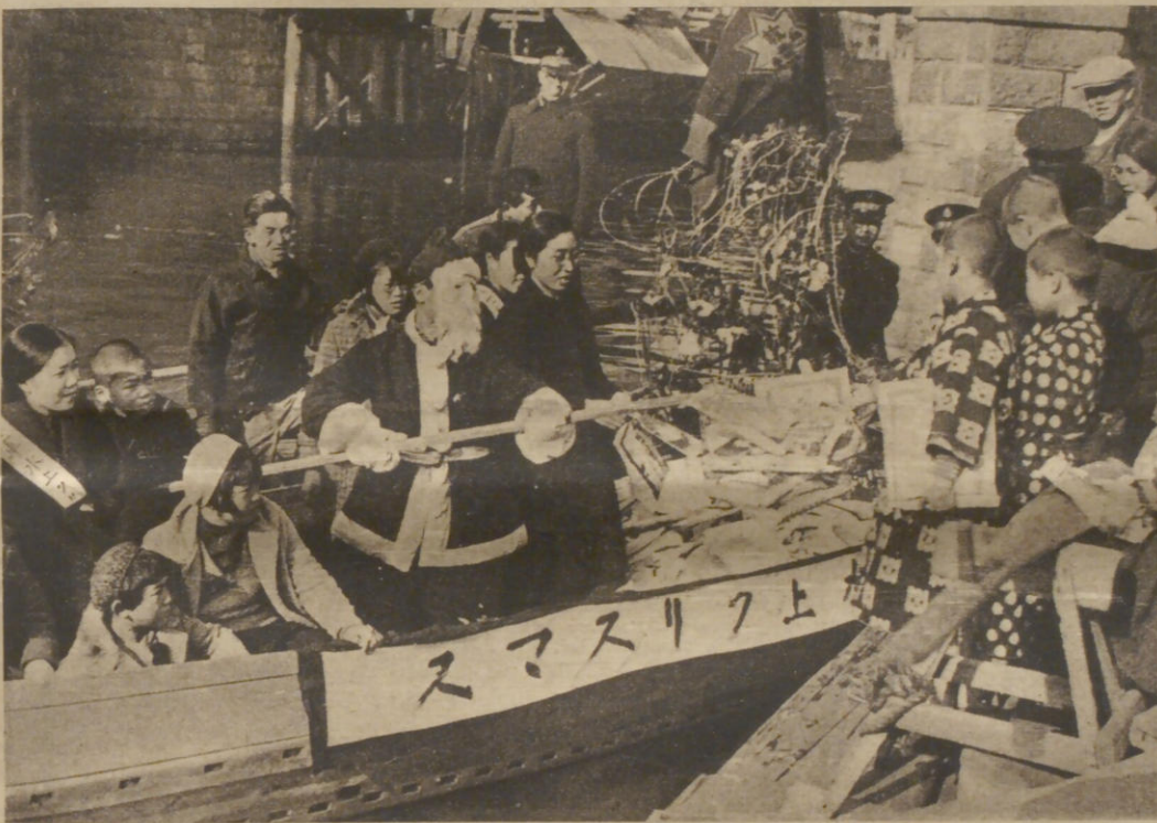
Der japanische Weihnachtsmann bringt auf einem Boot den Kindern aus den Armenquartieren von Tokio seine Liebesgaben