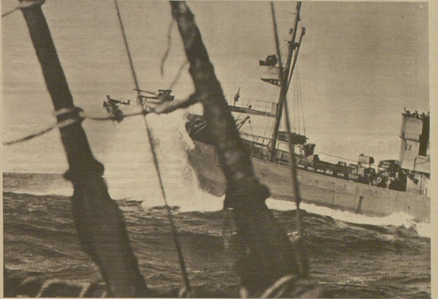
Ran an den Feind!

„Versteht der Großstädter wirklich die Natur ganz?“