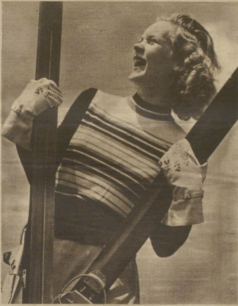
Fesch und fröhlich