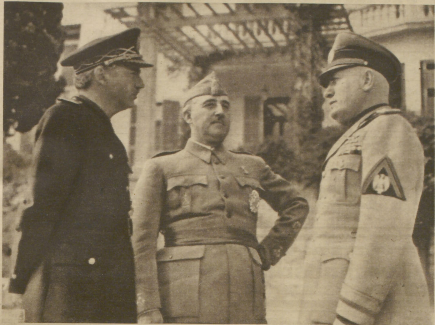
Franco bei Mussolini Zu einem Treffen mit dem Duce in Bordighera traf der spanische Staatschef Generalissimo Franco mit seinem Außenminister Serrano Suñer in Italien ein