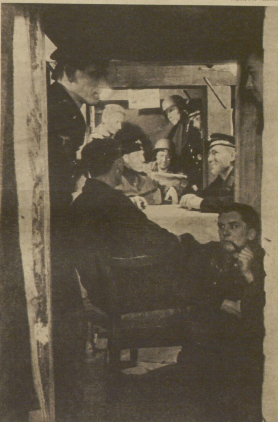
Im Luftschutzkeller am Kanal im Landquartier einer Marineeinheit Die Alarmglocke hat das Herannahen der Tommies gemeldet. Rasch sind alle Männer, die keinen Dienst haben, aus den Kojen und sitzen wenige Minuten später im sicheren Keller

Ein Zustand, der alle Tage neuen Verdruß zuzieht, ist nicht der rechte.