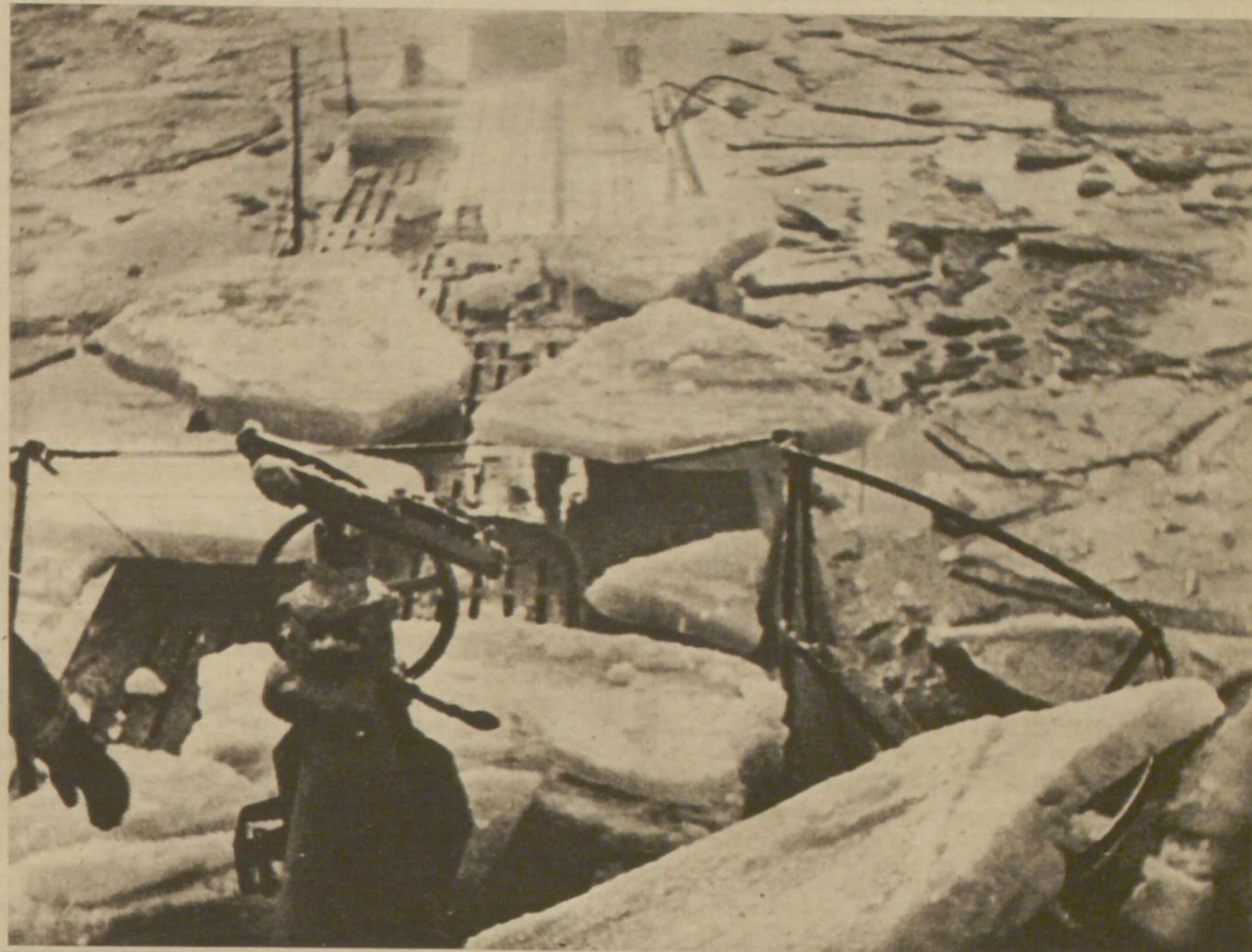
Ein harter Weg für das heimkehrende Schiff Dicke Eisschollen schieben sich über das Vorschiff des von Feindfahrt zurückkehrenden Unterseebootes Aufn. PK-Atlantic