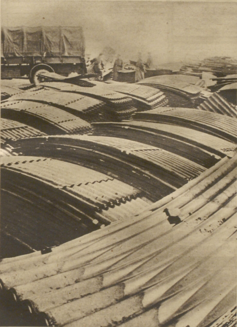
Aus einem Armeepionierpark In großen Stapeln liegen Wellbleche zur Ausgabe bereit