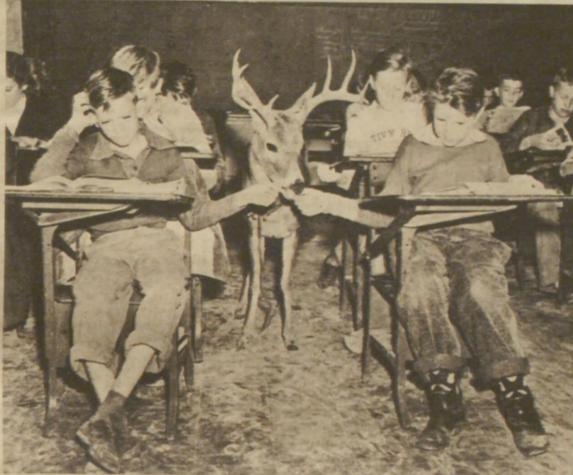
Ein zahmer Hirsch — das Glückstier von Kerrville in Texas Er bewegt sich frei im ganzen Ort und kommt gelegentlich auch in die Schule, um von den Jungen etwas Frühstücksbrot zu erbetteln