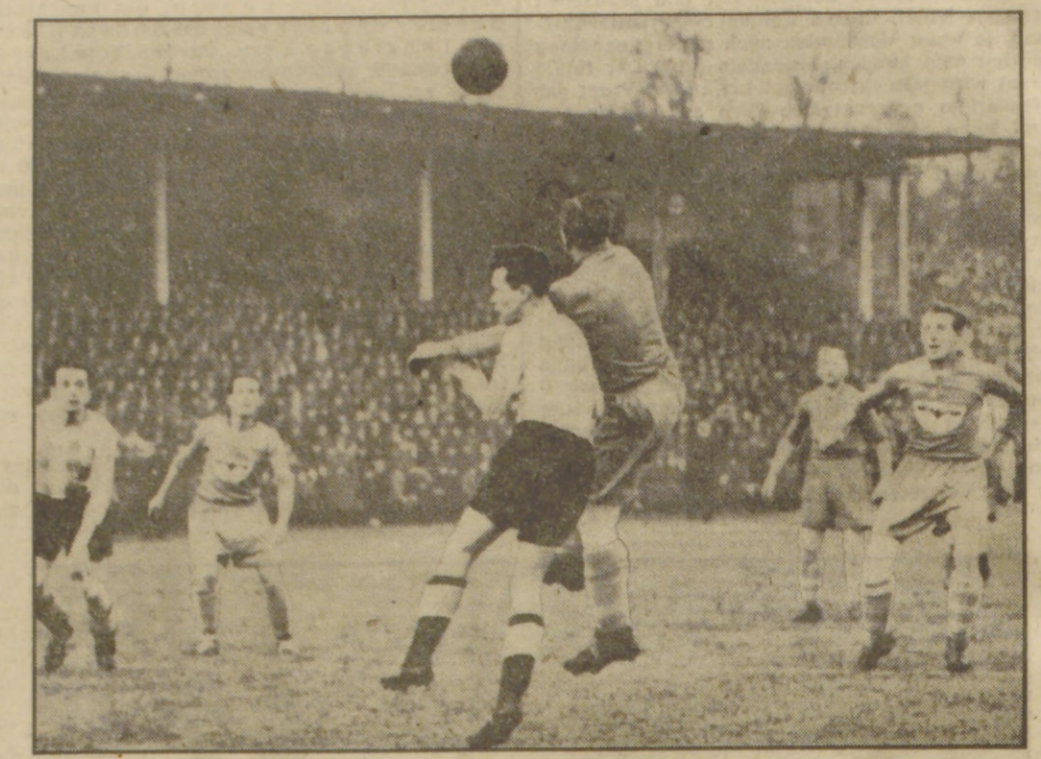
50 000 Zuschauer im Kölner Stadion. Das bedeutendste Spiel im deutschen Fußball in den letzten Wochen war die Pokalrevanche zwischen München 1860 und Schalke 04. Das spannende Spiel endete 0:0.

Und wie steht es im Westen? Außer Schalke wird vielleicht auch ein anderer Altmeister, der