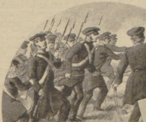
Die Hanseatische Legion im Freiheitskampf 1813