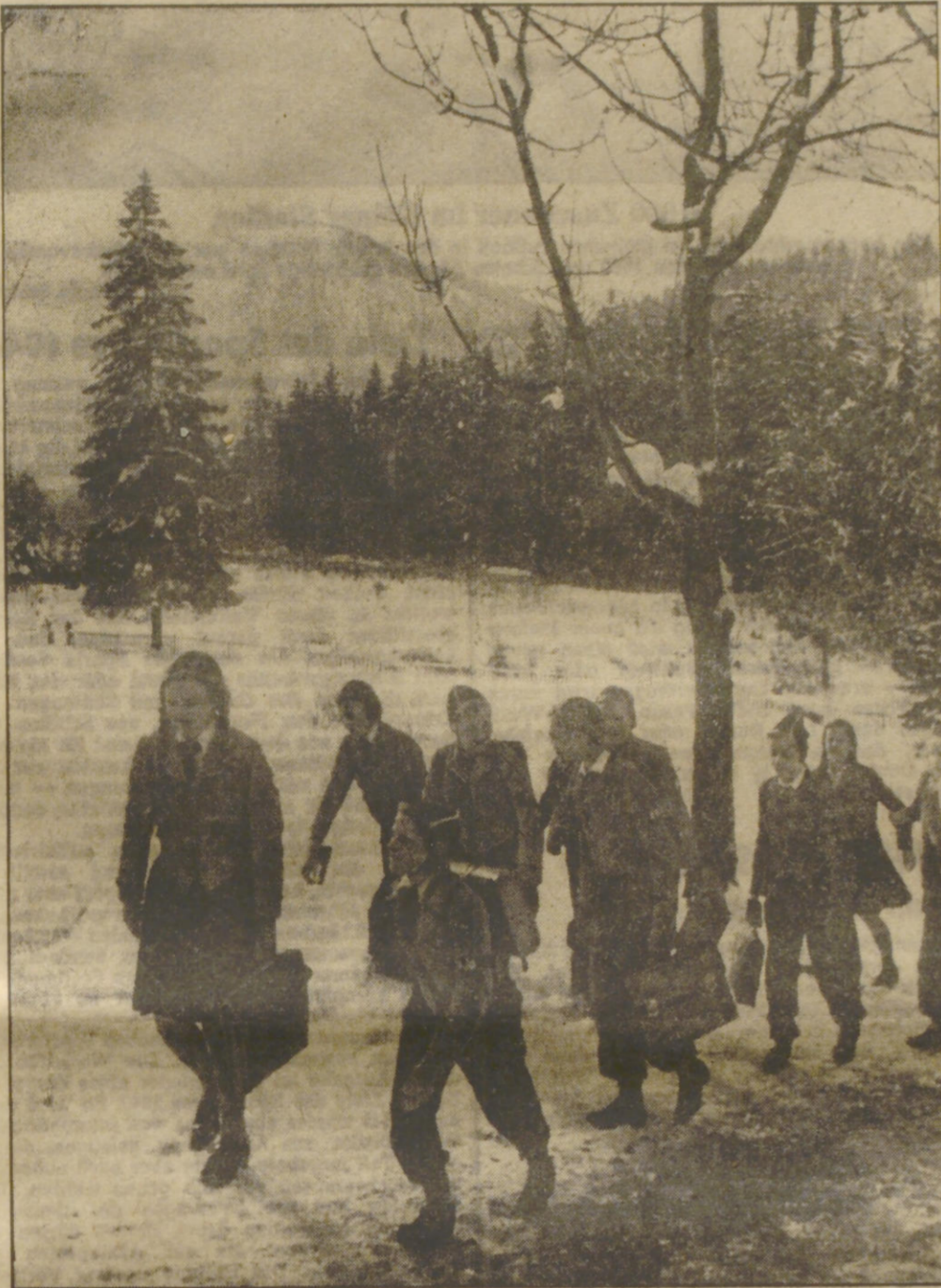
Auf dem Weg zur Schule