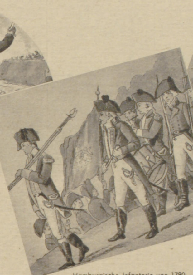
Hamburgische Infanterie von 1780