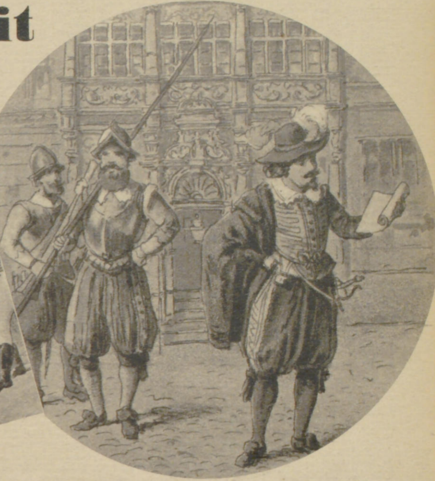
Die Bürgerwache von 1634