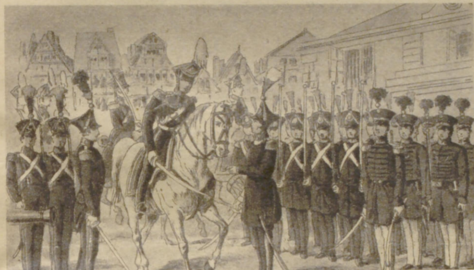
Das neuaufgestellte Bürgermilitär von 1815

gänglichen Ruhm an ihre Fahnen geheftet haben und bei ihrer siegreichen Heimkehr mit Ehren überhäuft wurden.