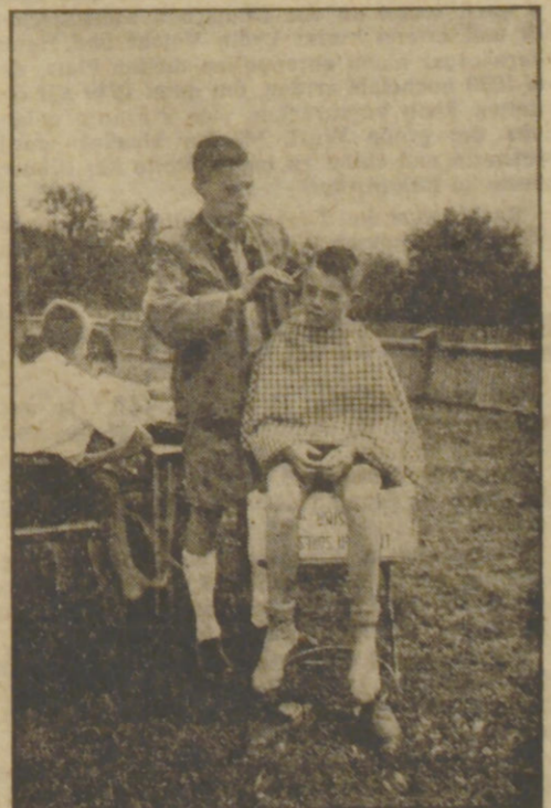
Der Lagerleiter muß alles können, auch die Haare schneiden

Heute ist die Erziehungsarbeit in den Lagern eine feste Form gegossen, sie ist ein Bestandteil der Jugenderziehung überhaupt geworden. Um so mehr, als die Lagerzeit auf ein halbes Jahr begrenzt wurde und dadurch ein ständiger Wechsel eintrat, so daß alle Jugendlichen, die sich freiwillig gemeldet hatten, einmal — manche sogar mehrmals — in ein Lager reisen konnten.