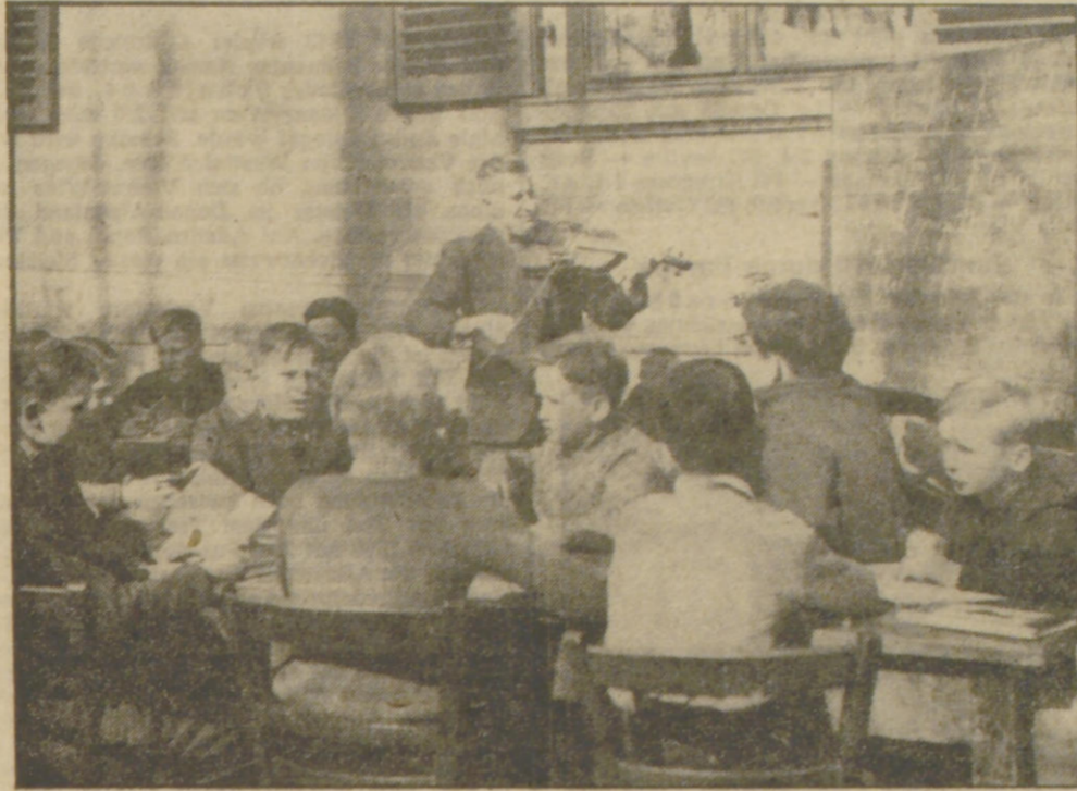
In der Singstunde

Es ist klar, daß die Jungen und Mädels auch in den Lagern die beste Fürsorge zuteil wird, die man sich denken kann. Abgesehen von der zu-