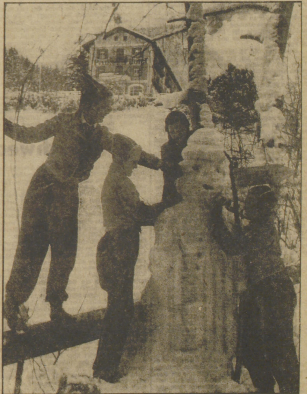
Wird unser Schneemann nicht wunderschön?