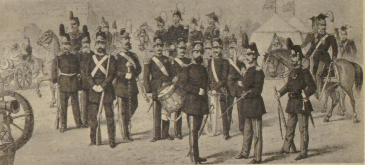
Das Bürgermilitär kurz vor der Auflösung 1866, nach der Parade auf dem Heiligengeistfeld