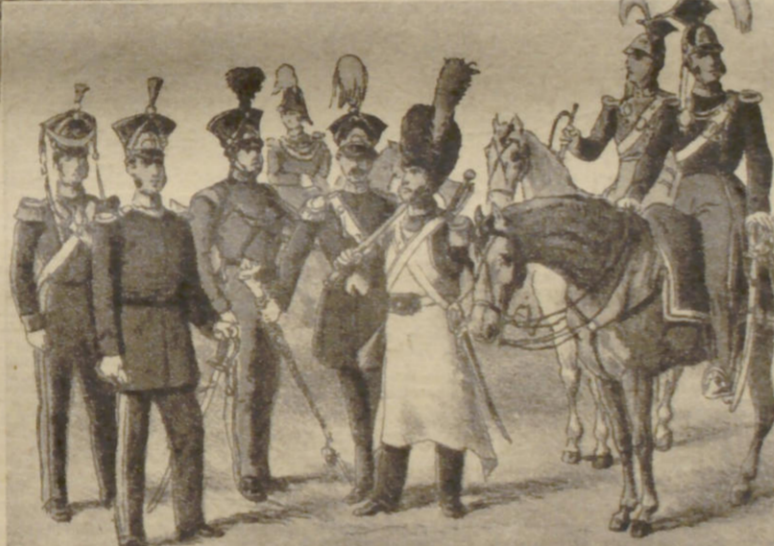
Die verschiedenen Truppengattungen des Bürgermilitärs von 1840

gänglichen Ruhm an ihre Fahnen geheftet haben und bei ihrer siegreichen Heimkehr mit Ehren überhäuft wurden.