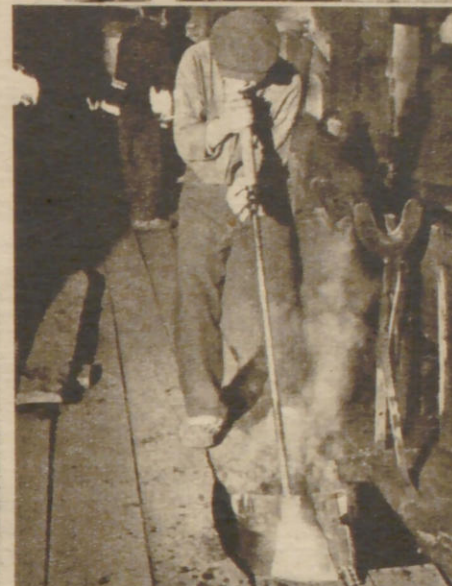
Kriegsgefangener hat sich als Glasbläser entpuppt und muß sich ans Werk machen, Fensterscheiben für die Bunker herzustellen. Sorgfältig verpackt geht das zerbrechliche Gut nach vorn