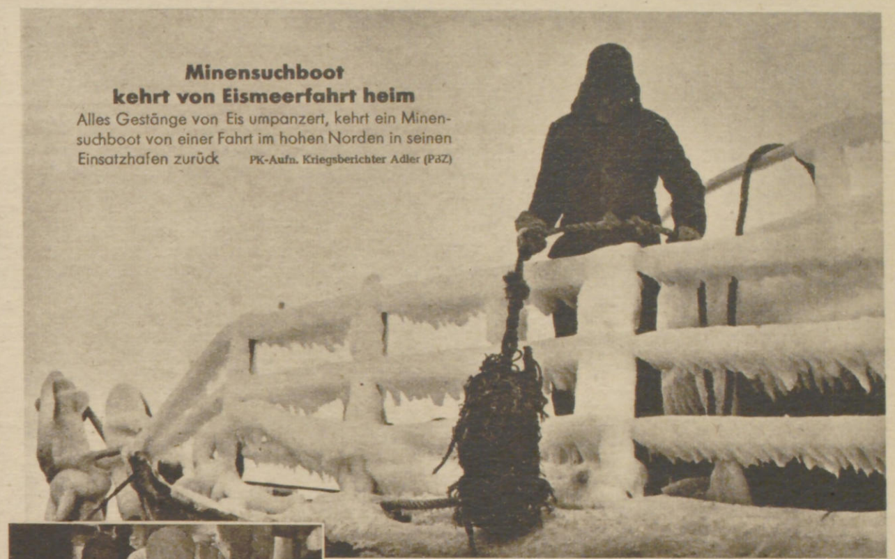
Minensuchboot kehrt von Eismeerfahrt heim Alles Gestänge von Eis umpanzert, kehrt ein Minensuchboot von einer Fahrt im hohen Norden in seinen Einsatzhafen zurück