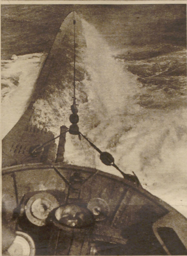
Das deutsche Unterseeboot: Auf allen Meeren, vor allen Küsten