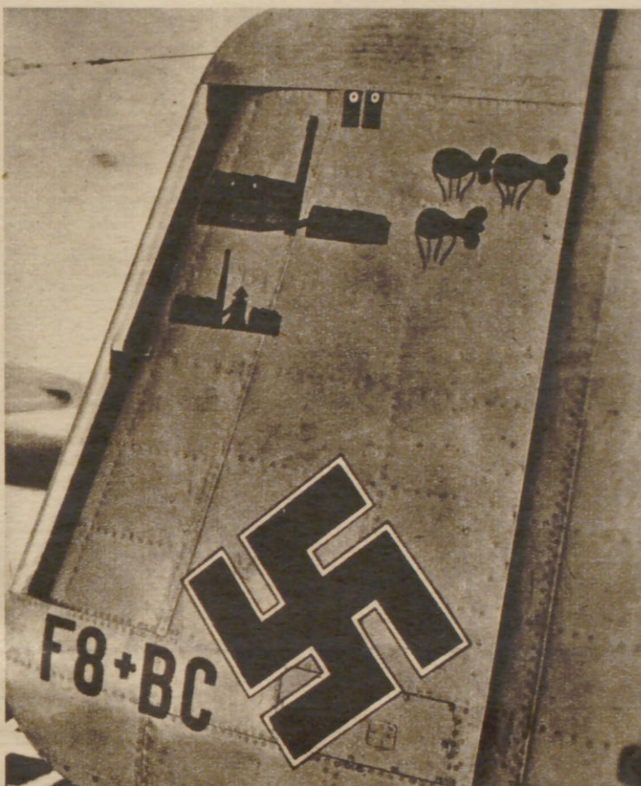
Buchführung auf dem Seitenleitwerk Zwei wichtige englische Fabriken, drei vernichtete Sperrballone und zwei Abschüsse feindlicher Flugzeuge sind auf dem Seitenleitwerk dieser Do 217, die von dem Ritterkreuzträger Oberleutnant Schmitter geflogen wird, verzeichnet