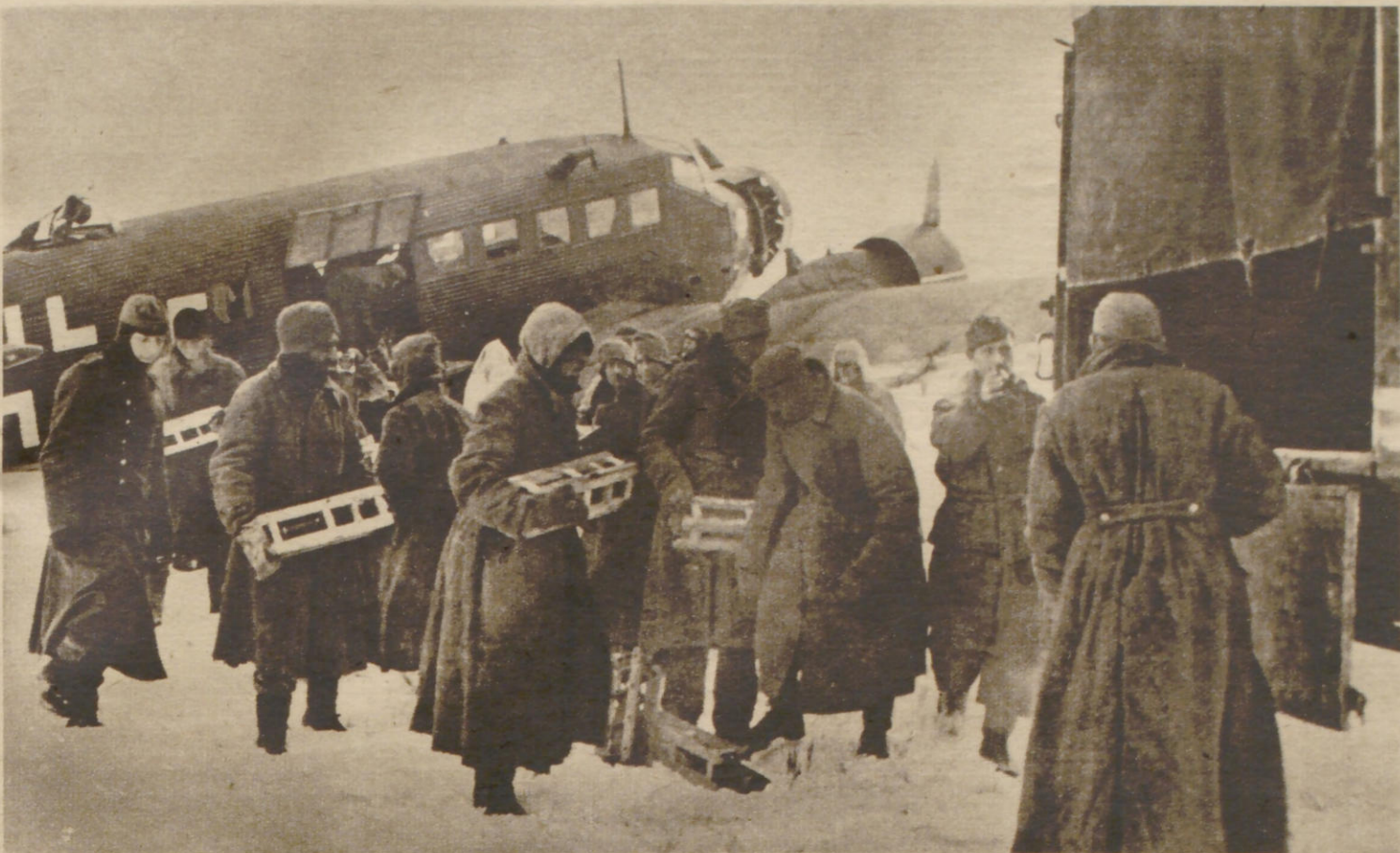
Transportflugzeuge für die Versorgung vorgeschobener Stützpunkte im Osten