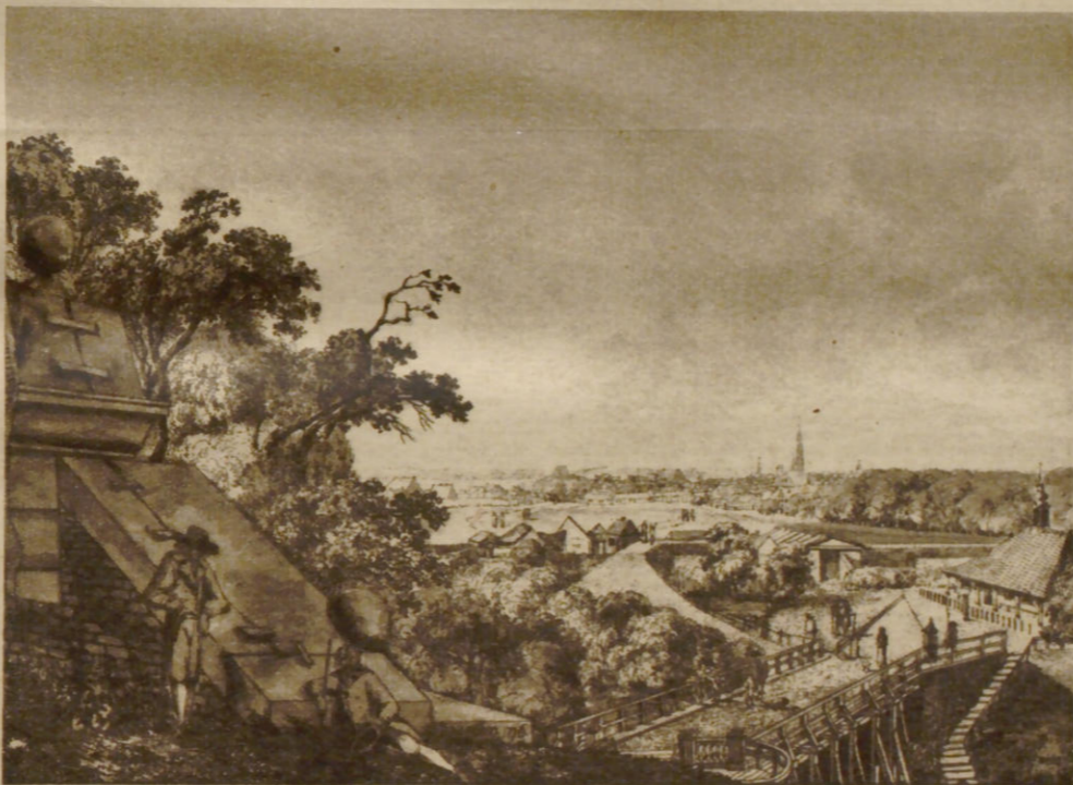
Blick von der Bekrönung des Millerntors auf den Hamburger Berg nach einer Radierung von F. Rosenberg aus dem Jahre 1796