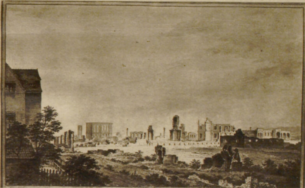
Ein Aquarell von Jess Bundsen hat uns das Aussehen des Hamburger Bergs nach der Zerstörung durch die Franzosen 1814 überliefert