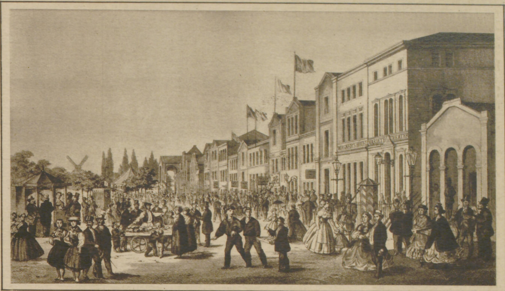
Der Spielbudenplatz, wie diese Lithographie von D. M. Kanning ihn uns zeigt, spiegelt das damalige Eigenleben der Vorstadt St. Pauli wider

Wir können uns hier im einzelnen nicht mit dem neuen Aufbau nach der Franzosenzeit beschäftigen; jedenfalls stand die Kirche bald wieder, und auch in die Vergnügungstätten kehrte das alte