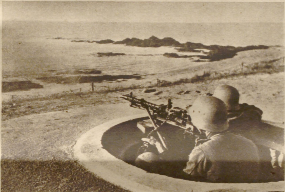
Der Atlantikwall steht

Der kleine betonierete Maschinengewehrstand bietet ein besonders schwer zu nehmendes Ziel. Wer in den Wirkungsbereich seines Maschinengewehrs kommt, ist verloren