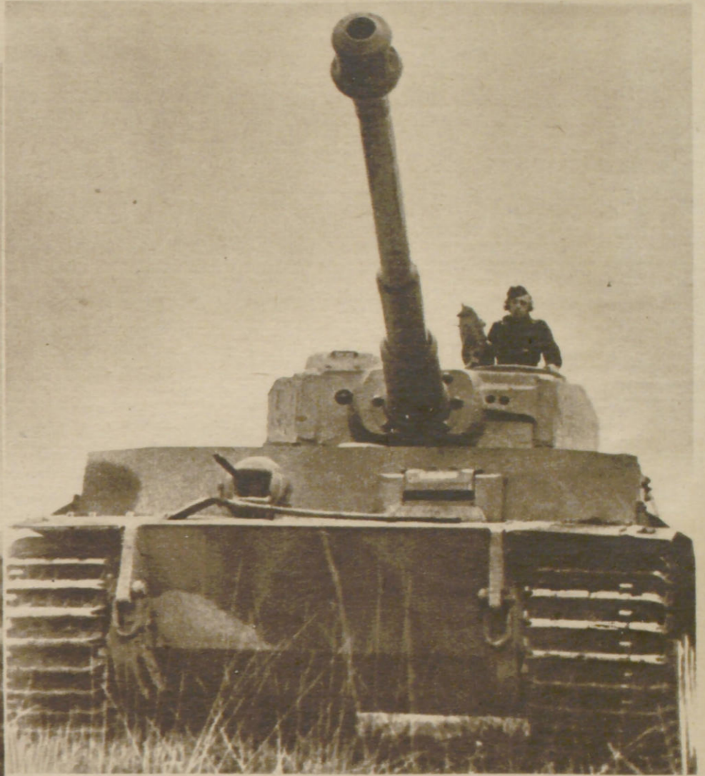
Vorderansicht des Panzers „Tiger“