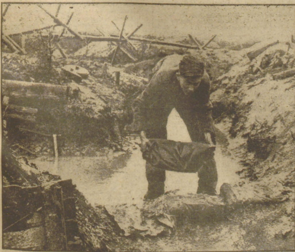
Mit Sandsäcken versucht der Soldat das Wasser vom Postenstand abzuleiten und sich vor der Überschwemmung zu schützen