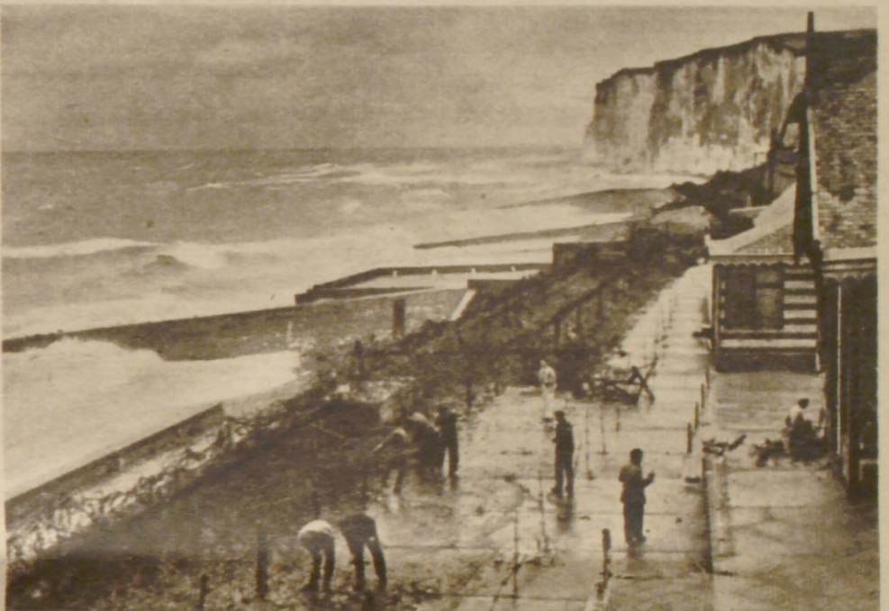
Ragende Burgen aus Stahl und Beton

Das Herzstück der gewaltigen deutschen Abwehrfront vom Mittelmeer bis zum Nordkap bilden die Küsten am Kanal und am Atlantik. Mächtigen Burgen gleich ragen an vielen Stellen die Befestigungswerke und Bunker an der Meeresküste empor