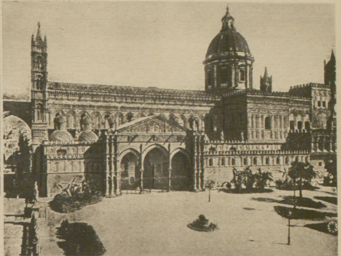
Der Dom von Palermo

1185 an Stelle einer maurischen Moschee geweiht, haben viele Jahrhunderte an ihm weitergebaut. Im Innern des gewaltigen Bauwerks die Königsgräber der Normannen