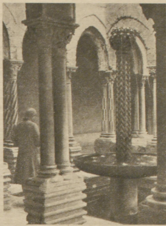
Der Brunnenhof im Kreuzgang der Kathedrale von Monreale

Dieser Kreuzgang ist der größte und schönste des italienisch-romanischen Stils, mit Anklängen an die sarazenische Baukultur. 216 Säulen tragen paarweise die Spitzbögen; die meist reich ornamentierten Säulenschäfte sind mit erstaunlicher Phantasie abwechslungsreich gestaltet. Der Kreuzgang stammt aus der Zeit um 1200