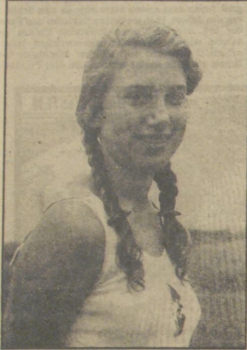
Gesund und kräftig schaut es aus, dies sportgestählte BDM-Mädel

Im Vordergrund steht verständlicherweise die Leichtathletik, die auch beim Reichssport-