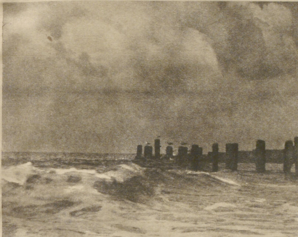
Abendstimmung am Meer

Jüdische Blätter Amerikas haben zur Vernichtung aller Kulturdenkmäler Europas aufgefordert: „Denn es ist ja nicht unsere Kultur“, schreiben sie. Freilich nicht, denn ihre „Kulturwerte“ sind z. B. Explosivbleistifte, die Kinderhände abreiben, und ihre „Literatur“ sind Huldigungstelegramme an Bombenflieger, die tausendjährige Kirchen zerstören. Kostbare Werte sinken dahin — und doch wissen wir: Europa und seine Kultur, sie werden auch diesen Rausch der Vernichtung überleben!