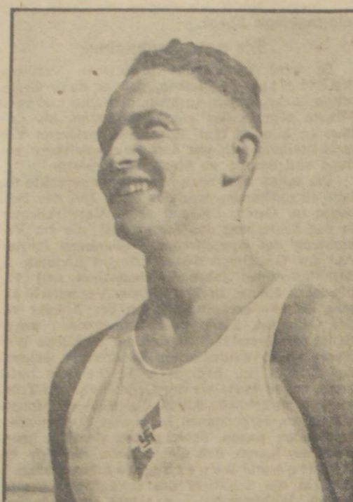
Heute noch ein unbekannter Hitlerjunge, morgen vielleicht schon ein Meister auf der Äschenbahn

Ziel und Sinn aller Leibesübungen in der Hitler-Jugend ist die Wehrhaftmachung der Jungen. Die Krönung aller sportlichen Erziehung ist die Wehrrüchtigung, die in den