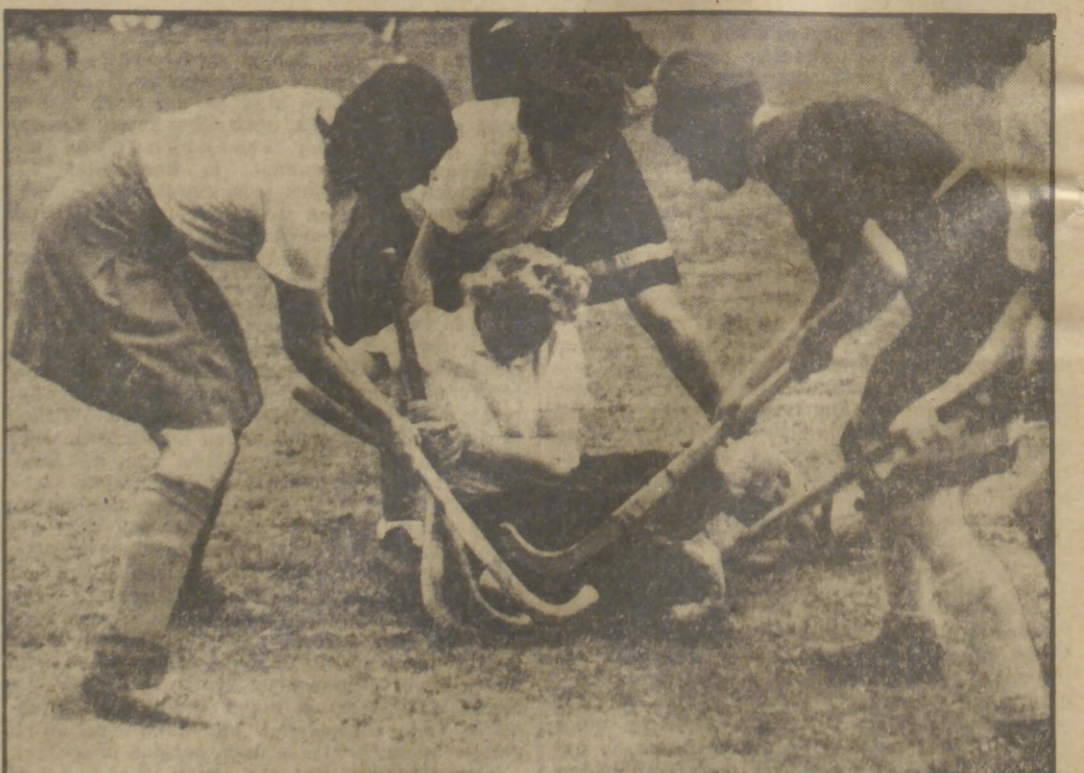
In der Vorschlußrunde um die Deutsche Kriegshockey-Meisterschaft schlugen die temperamentvollen Frauen von Harvestehude-Hamburg die Berlinerinnen vom BHC hoch 6:1. Am Boden die Berliner Torwächterin Frau Kurb, die anscheinend bei diesem Geplänkel zu „kurz“ kommt!