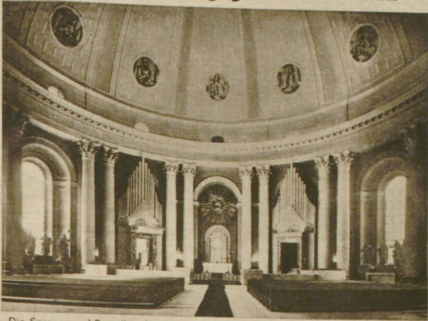
Die Spreng- und Brandbomben wüten unterschiedslos: sie zerstörten das edle Rund der katholischen St. Hedwig-Kirche in Berlin (Bild in der Mitte), ebenso das klassisch schöne Treppenhaus der Bayerischen Staatsbibliothek in München zusammen mit wertvollen Bilderschätzen (Bild links oben zeigt den prunkvollen Treppenaufgang) und die prächtige Aula der Kunstakademie in Düsseldorf (Bild links unten)