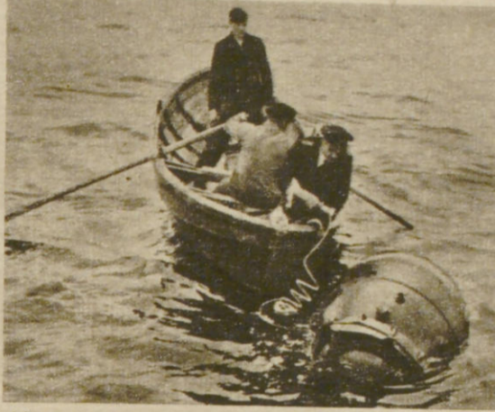
Minensprengkommando bei der Arbeit an der norwegischen Küste. Oben: eine Sprengladung wird an die Mine, die im freien Wasser vernichtet werden soll, befestigt; unten: eine auf den Strand geratene Mine wird entschärft