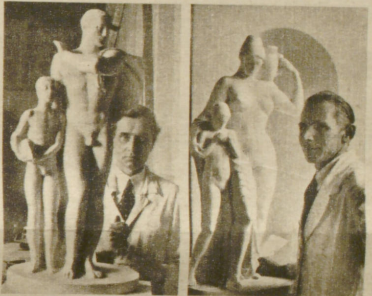
Schiffer mit Sohn von Martin Irwahn

So sieht doch der Wasserturm in unserem Stadtpark nicht aus, denkt der aufmerksame Hamburger, der seinen Stadtpark kennt und schon häufig zugeschaut hat, wenn im Sommer die Jungen in dem Wasserbecken ihre Schiffe schwimmen lassen. Und er hat recht; denn die beiden Nischen, in denen wir je zwei Gestalten sehen, sind heute noch leer, und auf den Postamenten wird man die ruhenden Frauengestalten, die sich auf dem