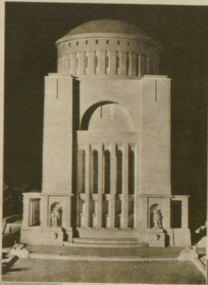
Modell des Wasserturms in seiner künftigen künstlerischen Ausgestaltung

Die ruhenden Frauengestalten versinnbildlichen das Wasser als Nahrungsquelle. Ausführende Künstler: links Richard Steffen, rechts Martin Irwahn