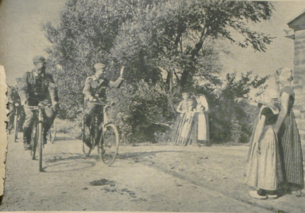
Junge Mädchen am Wege, wo es zur Arbeitsstelle geht. Das muß ja Glück bringen!