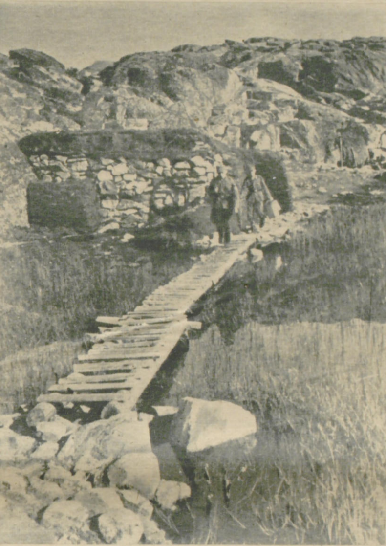
Ein Lattenrost führt über ein Moor zu den vordersten Postenstellungen an der Eismeerküste

Deutsche Arbeitsmänner und Soldaten an der niederländischen Küste, bald hier, bald dort, immer wo es der Einsatz erfordert, verstehen es ausgezeichnet, sich mit der Bevölkerung gut zu stellen. Vor allem mit den „Meisjes“. Wo Jugend zu Jugend kommt, ist Verständigung leicht