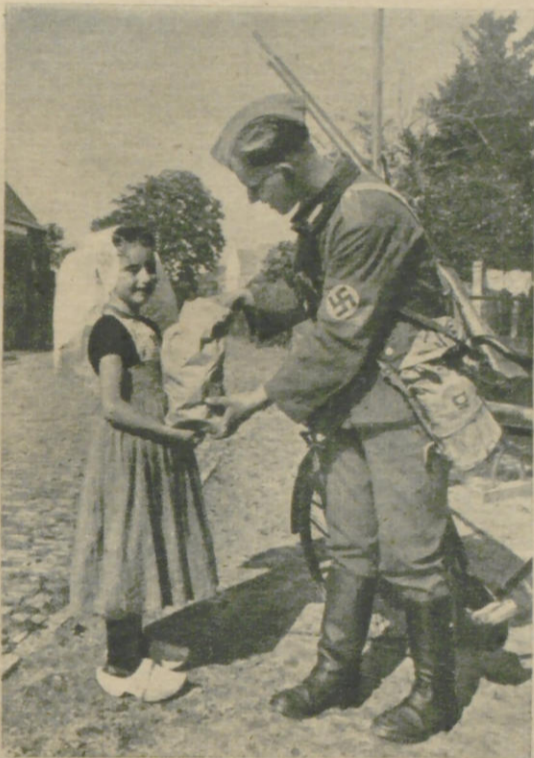
Von den duftenden Äpfeln, die sie eben gepflückt hat, kriegt „ihr“ Soldat einen ab