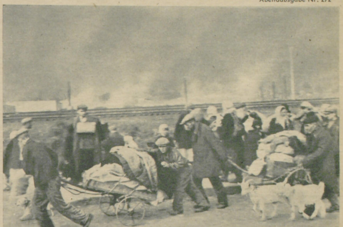
Endlose Kolonnen vor den Bolschewisten fliehender Ukrainer auf der Rückmarschstraße