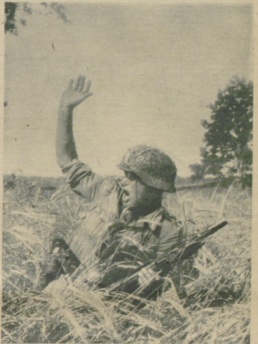
Ein Polizei-Stoßtruppführer gibt Feuerbefehl auf einen Trupp Banditen, der endlich gestellt worden ist