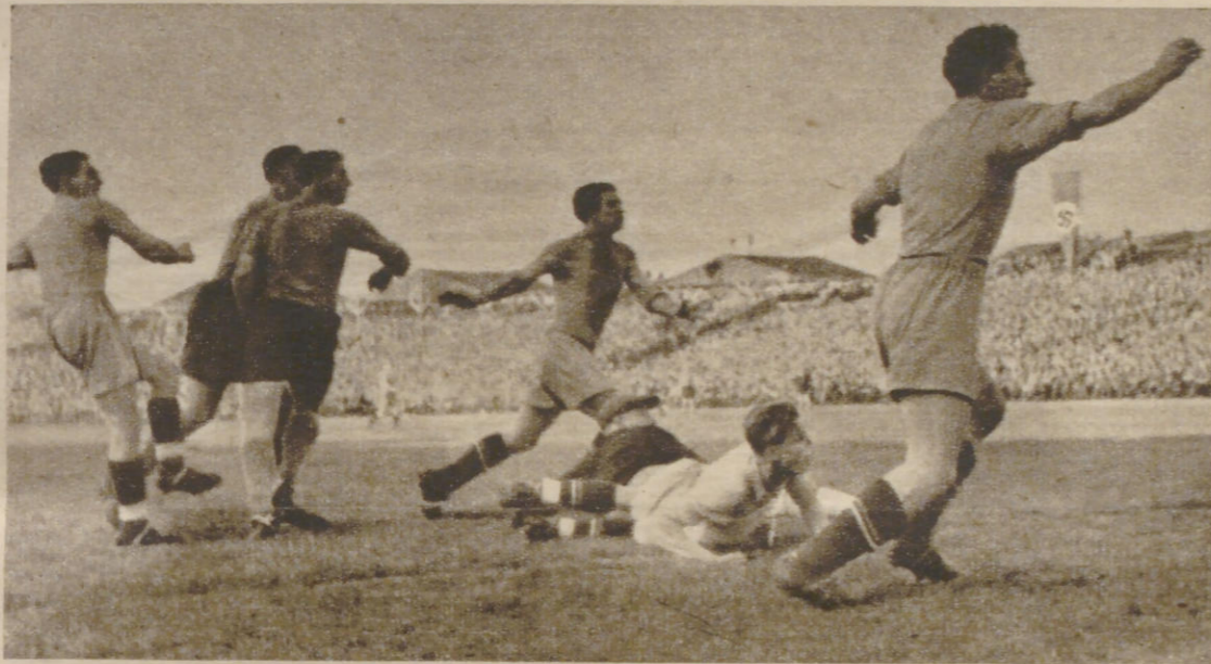
... schon liegen die Wiener temperamentvoll im Angriff und ...

Vor mehr als 40 000 begeisterten Zuschauern wurde in Stuttgart das Endspiel um den von allen deutschen Fußball-Vereinen heißbegehrten Tschammer-Pokal ausgetragen. Nach dramatischem Spielverlauf siegte der bereits 50 Jahre alte Wiener Altmeister Vienna-Wien über den erst vor Jahresfrist gegründeten Luftwaffen-Sport-Verein Großhamburg nach Spielverlängerung knapp 3:2. Bei der Pause führten die tüchtigen Hamburger Flaksoldaten mit 1:0, nach Ablauf der regulären Spielzeit stand das Treffen 2:2. Dann besiegelte anscheinend ein Hamburger die höchst ehrenvolle Niederlage der Hamburger Mannschaft. Noack, früher Hamburger Sport-Verein, jetzt Gastspieler bei der Vienna, erzielte das entscheidende dritte Tor. Der Pokal wandert nach Wien, aber wie die Sieger, so wurden auch die tapferen Unterlegenen von der Wasserkante für ihre großartigen Leistungen stürmisch gefeiert. Die Wahrung Hamburger Sport-interessen lag bei den Luftwaffen-Soldaten wahrlich in den besten Händen.