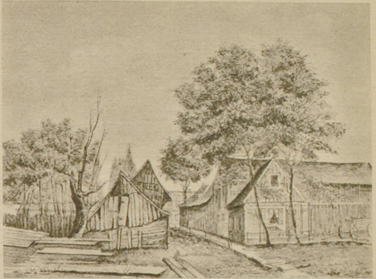
Die „Caneeltwiete“ auf dem Borgesch hatte ihren Namen wegen der umherliegenden Hobespäne erhalten

Während die meisten Stadtteile Hamburgs sich aus ehemaligen Dörfern, also aus uralten Siedlungsgebieten zunächst zu Vororten entwickelten, und später als Stadtteile der städtischen Verwaltung angegliedert wurden, ist Borgfelde, wie schon der Name andeutet, ein Burgfeld gewesen, das den Stadtbewohnern als Gemeindefeld angewiesen wurde. Daran erinnert noch heute der Straßenname „Bürgerweide“, der früher richtiger „An der Bürgerweide“ hieß.