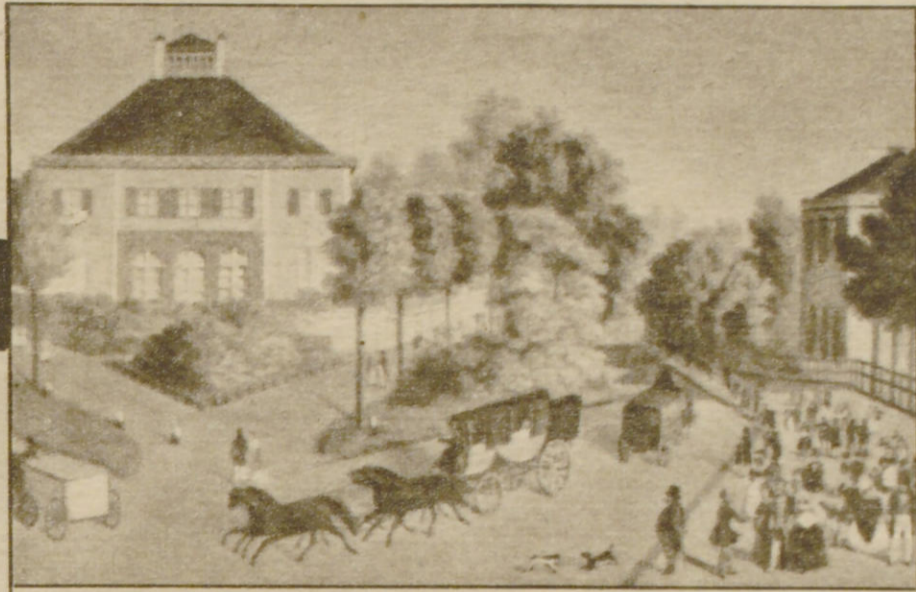
Landhaus des Senators Gabe um 1850