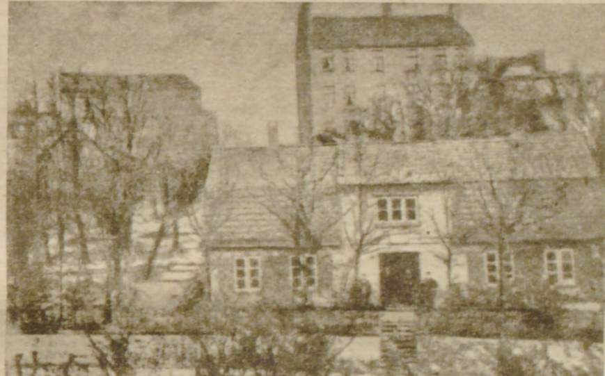
Hagedorns Gasthof „Zum Frohsein“ Oben Borgfelde 27/29

Die Campestraße und die Basedowstraße sind benannt nach den in mancher Beziehung eng verbundenen Menschenfreunden und Jugendbildnern Joachim Heinrich Campe (1746—1818) und den in Hamburg geborenen berühmten Pädagogen Johann Bernhard Basedow (1723—1790). Campe hatte in der Nähe der nach ihm benannten Straße eine Erziehungsanstalt nach den Grundsätzen des Basedow'schen Philantropium in Dessau gegründet, an dem er vorher eine Zeitlang wirkte. Er ist auch der Verfasser des vielgelesenen Buches „Robinson, der Jüngere“; Die später angelegte Salzmannstraße ehrt das Andenken an den Pädagogen Christin Gotthilf Salzmann (1744—1811), der aus der Basedowschen Anstalt hervorgegangen ist und später die Erziehungsanstalt Schneepfenthal bei Gotha gründete.