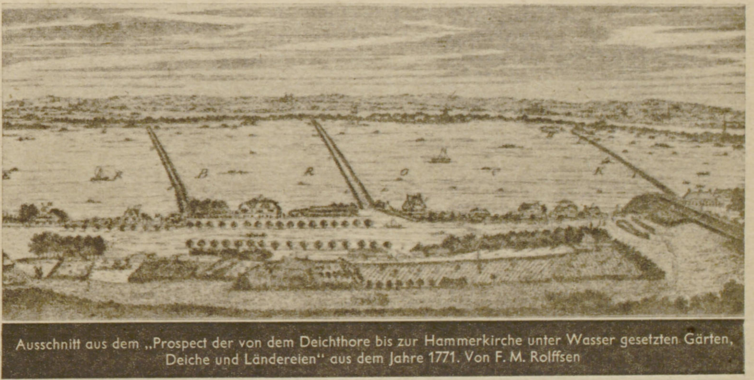
Ausschnitt aus dem „Prospect der von dem Deichthore bis zur Hammerkirche unter Wasser gesetzten Gärten, Deiche und Ländereien“ aus dem Jahre 1771. Von F. M. Rolfsen