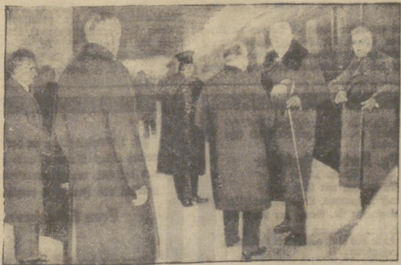
Auf der Durchreise nach dem Süden ist der König von Schweden in Berlin eingetroffen, wo ihn unser Bild bei der Ankunft am Bahnhof zeigt. Hier wurde er von dem schwedischen Gesandten begrüßt. König Gustav hat dem Reichspräsidenten einen Besuch ab-