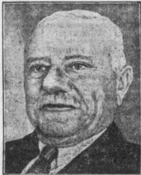
Der amerikanische Kupferkönig Daniel Guggenheim ist im Alter von 74 Jahren gestorben. Guggenheim, der aus einer deutsch-schweizerischen Familie stammte, schuf zahlreiche wohltätige Stiftungen, die er mit Millionen dotiert hatte.

als armer Teufel, eine faubere, wahrhafte und innerlich anständige Musik. Aufwachen tat sie ja doch keiner, materielle Vorteile lockten nicht. So ward eine reife, gerade gewachsene Kunst, die man heilig hielt, weil sie der Extrakt der besten, konzentriertesten Lebenssituation war.