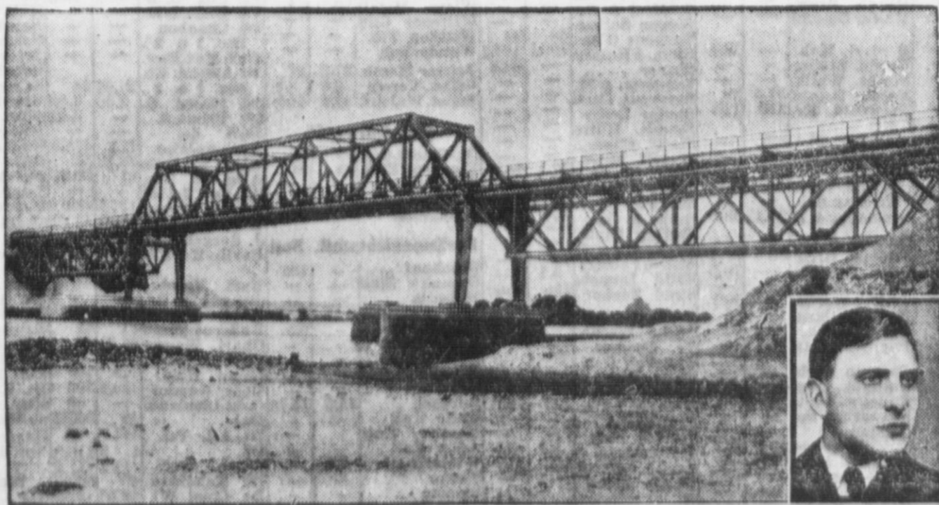
Diese Brücke über die Oder bei Stettin, die seit vielen Jahren unbenutzt dalag, kann jetzt dank des pommerischen Arbeitsbeschaffungsprogramms an den Verkehr angeschlossen werden. — Unten rechts: Der Staatsrat und Gauleiter Wilhelm Karpenstein, auf dessen Veranlassung hin der große pommerische Arbeitsbeschaffungsplan in Angriff genommen wird.